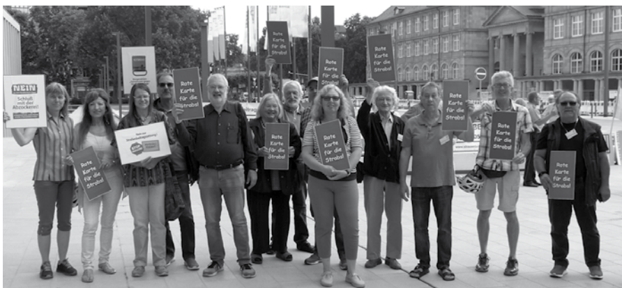
Demo gegen Straßenbeiträge in Wiesbaden - Teilnehmer aus Mörfelden-Walldorf.